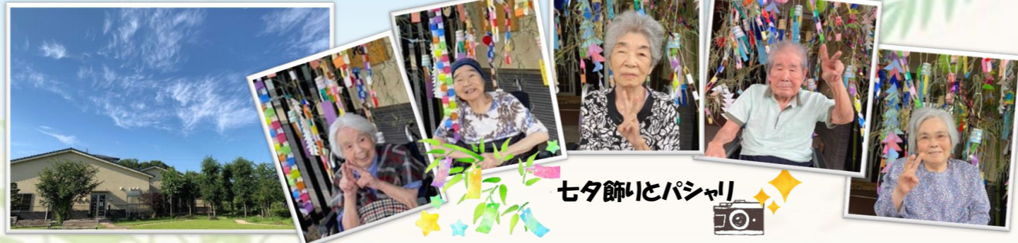
七夕飾りとパシャリ

木々の緑が眩しい季節がやってきました! 緑はいいですね、生命力を感じ、癒しを与えてくれます。そんな木々でセミが元気に合唱をはじめました♪ 夏本番を感じさせてくれますね。 令和3年の『夏』を楽しむため、職員が何やら計画しているようです。みんなで笑い、騒ぎ、全力で夏を楽しみ、暑さを吹き飛ばし元気に過ごしていきましょう!