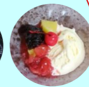
【鹿児島 南国しろくま】