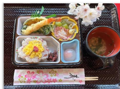
☆花見会でのお食事☆